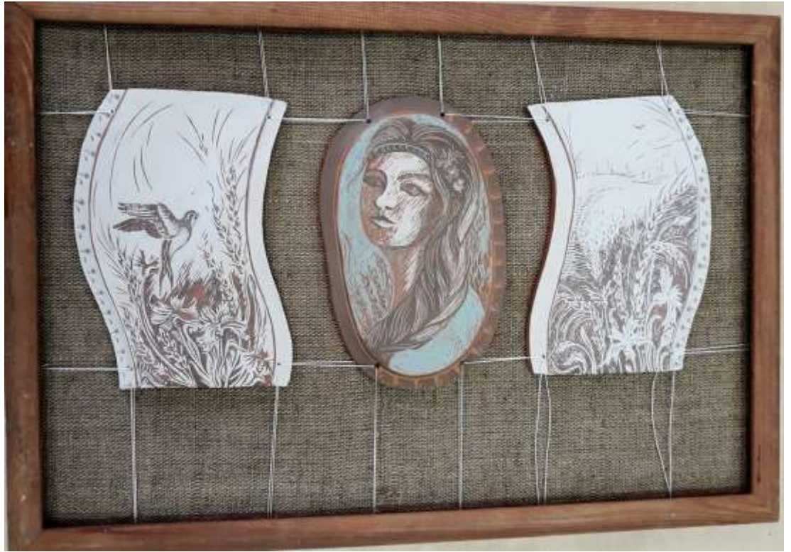
Триптих «Родные просторы» Материалы: красная глина, ангобы Максимова А.В., 2018 г.